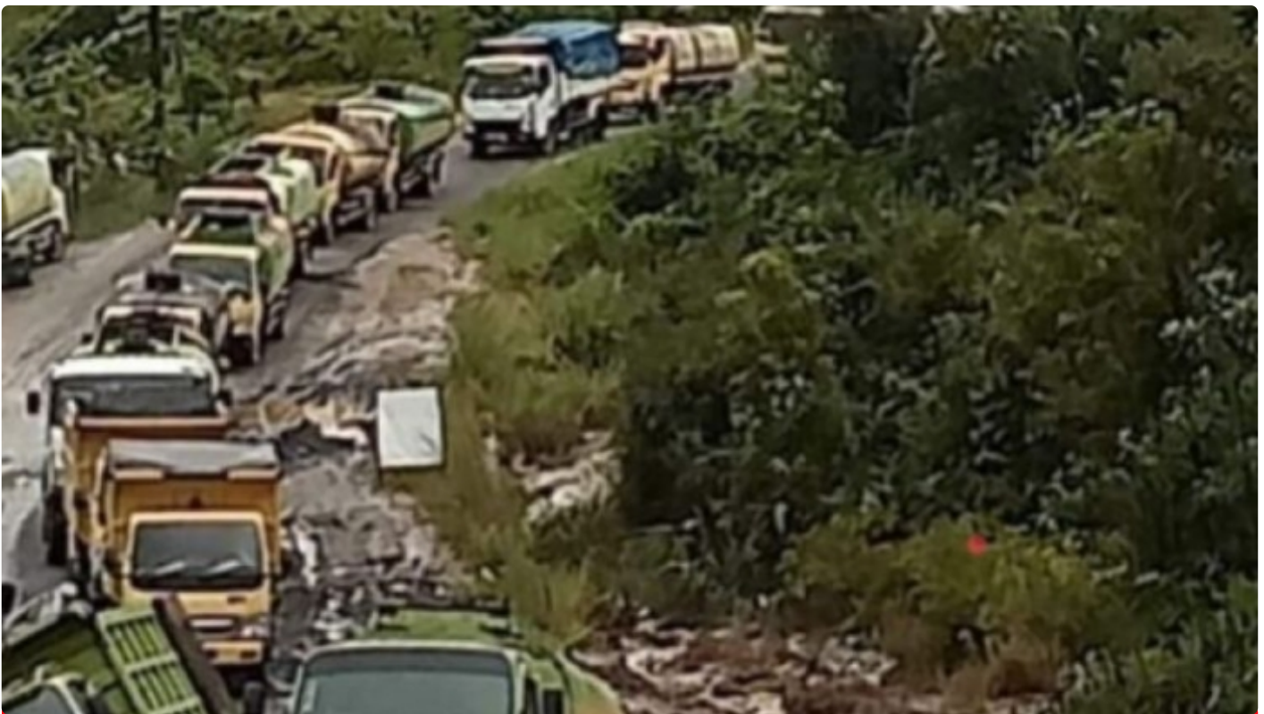
Gambar Saat Kondisi Jalan Kuala Kurun Gunung Mas

PALANGKA RAYA - Keprihatinan masyarakat Kabupaten Gunung Mas (Gumas) terhadap infrastruktur jalan yang selama ini mereka gunakan dalam aktivitas sehari - hari, belum lah selesai seperti apa yang diharapkan selama ini.