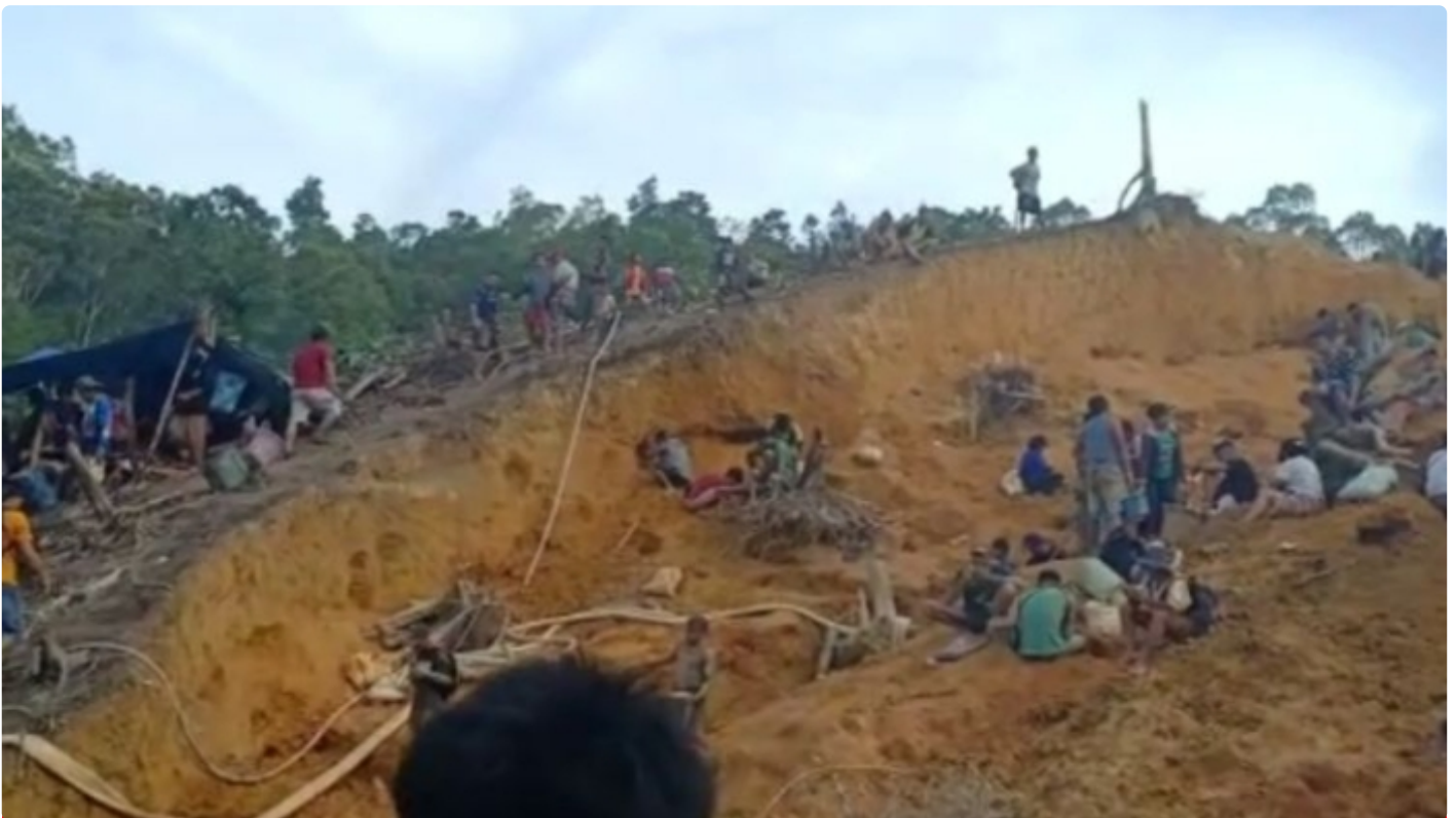
Lokasi Pertambangan Emas Yang Sempat Viral Saat Ini (Gambar diambil 15/01)

GUNUNG MAS - Beredarnya Video di media sosial (Medsos), baik itu Facebook dan pesan berbagi Whatshap selama ini ditengah masyarakat Tewah Kabupaten Gunung Mas (Gumas) Provinsi Kalimantan Tengah, aktivitas orang sedang mengambil bebatuan dari sebuah bukit yang terlihat longsor. Dan dalam video itu, bahwa bebatuan itu banyak mengandung emas.